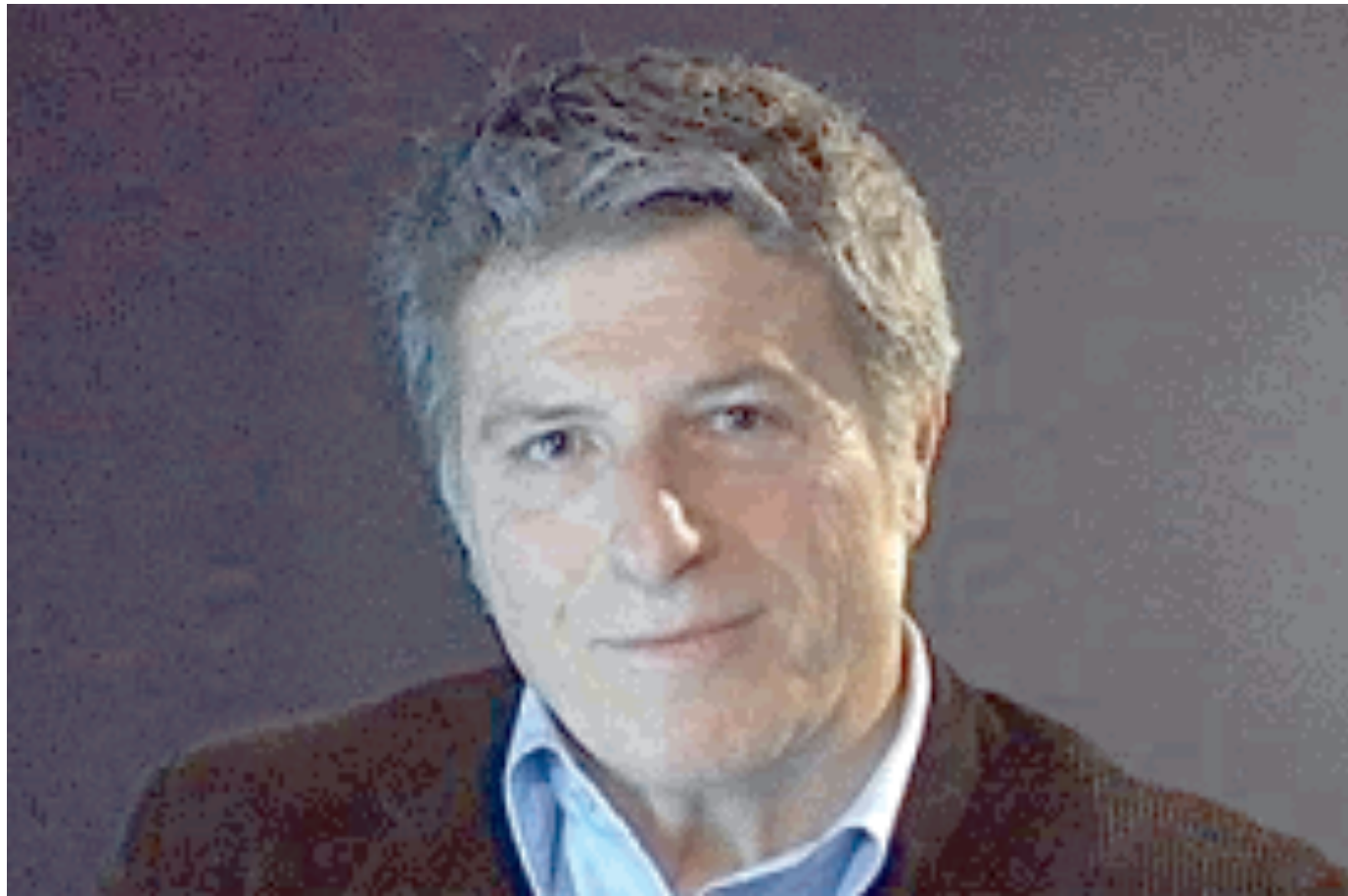
AL TEATRO PICCOLO ELISEO DI ROMA